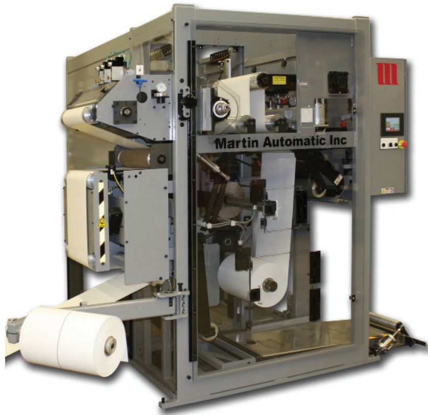
LRD Automatische Aufrollung mit Bahnkantensteuerung, Schneideeinheit und Hubtisch (Optionen)

Nonstop Aufrollung für Etikettenverarbeitung, flexible Verpackungen sowie für schmale bis mittelbreite Materialbahnanwendungen.